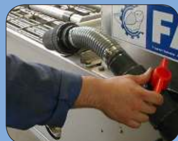
Alimentation en eau entièrement réglable par vanne