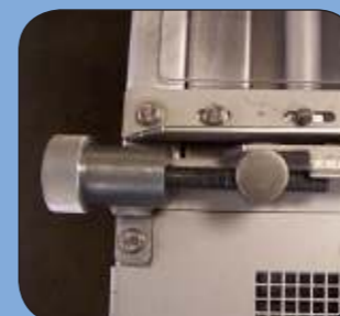
Vernier de réglage