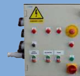
Boîtier électrique pour raccordement des compteurs et pompe (option)