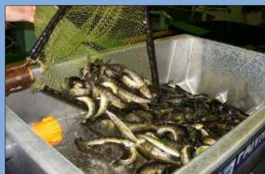
Smolts versé dans la trémie d'un trieur Helios 20