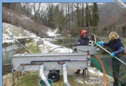
Trieur Helios 25