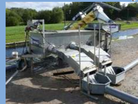
Trieur Helios 50