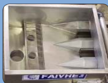
Vue de l'intérieur de la trémie d'entrée avec en option un piquage pour une pompe à poissons et un séparateur d'eau.