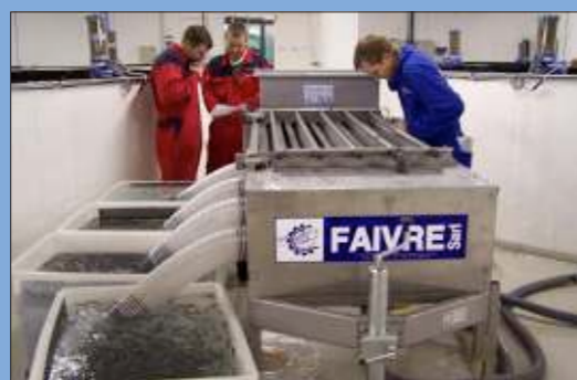
Trieur Helios 10 dans une écloserie de bars